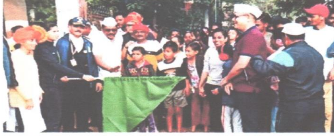
शहर में सैकड़ों शहरवासी दौड़ में शामिल हुए, मैराथन को हरी झंडी दिखाते हुए.