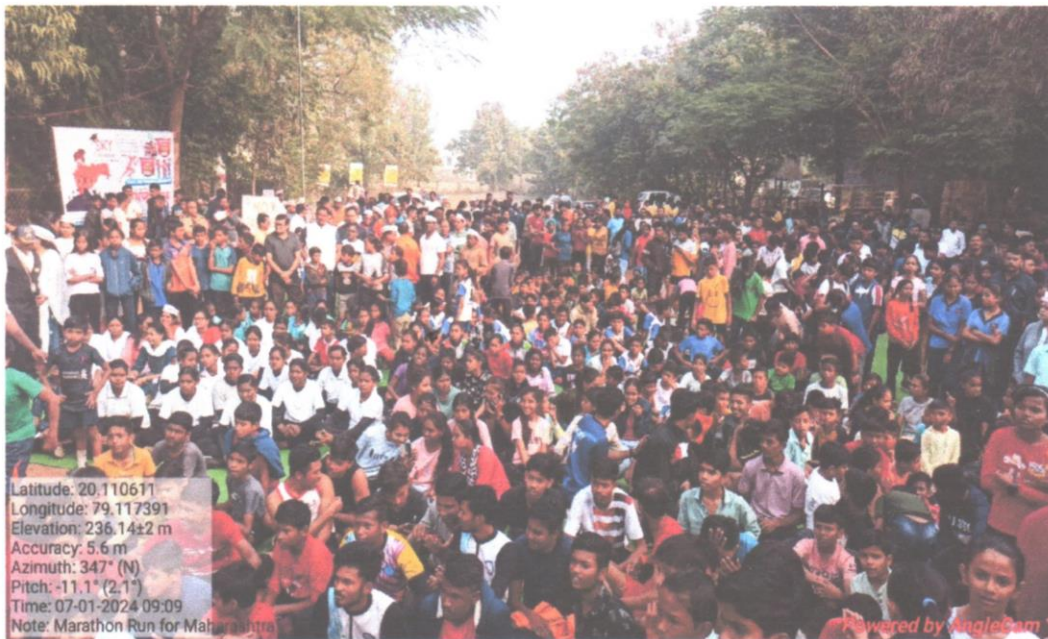
Participation of Children, Youth & Senior Citizen of Different Age Group