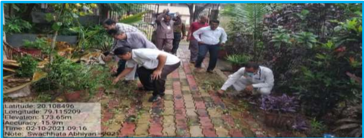
Swachhata Abhiyan on Gandhi Jayanti 02/10/2021