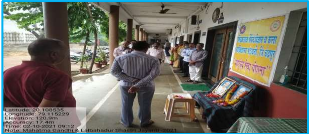
Gandhi Jayanti 02/10/2021