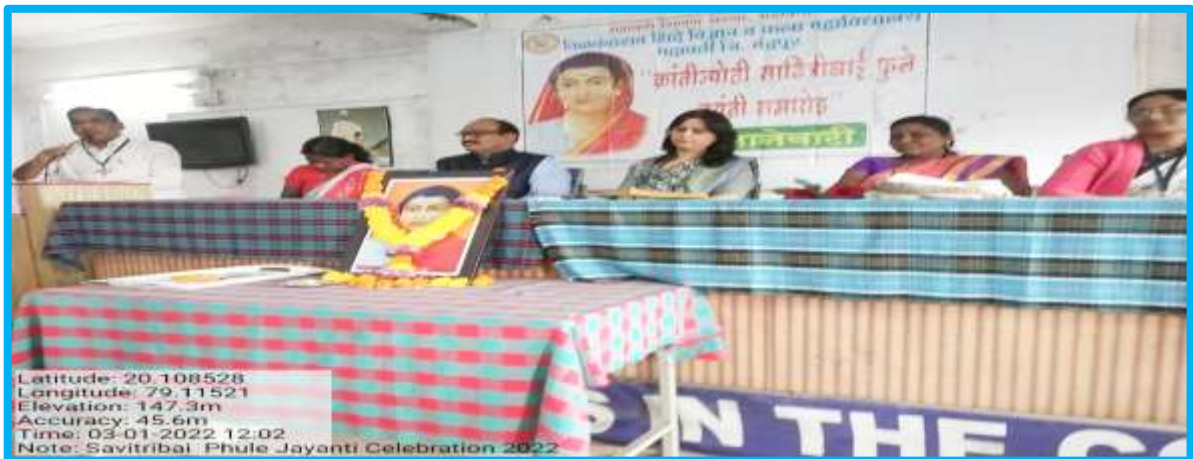
Savitribai Fule Jayanti 02/01/2022