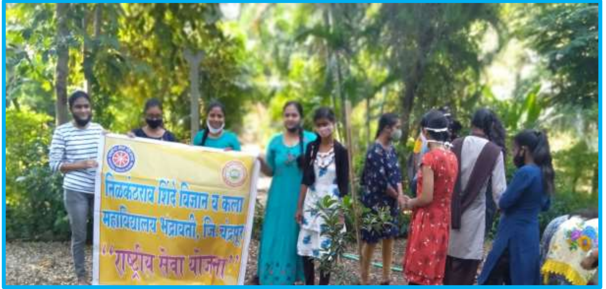
Swachhata Abhiyan on 27/10/2021