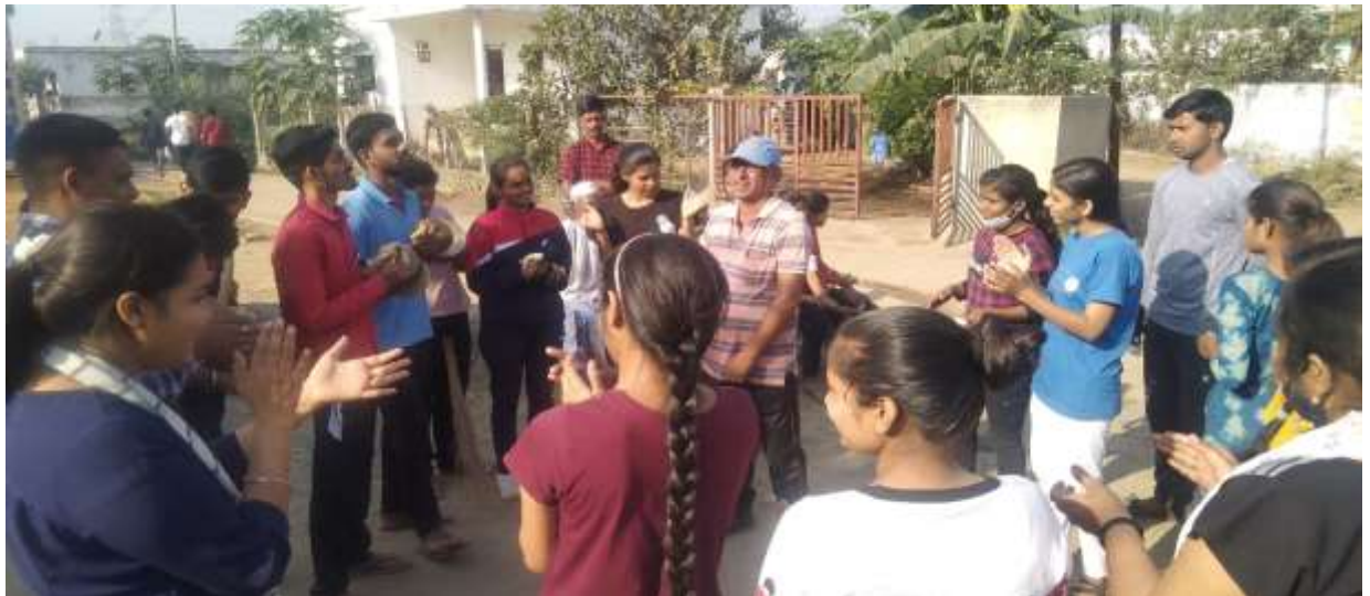
Street Play on Swachhata Abhiyan in NSS Camp at Chiradevi 10 - 16 th March 2022