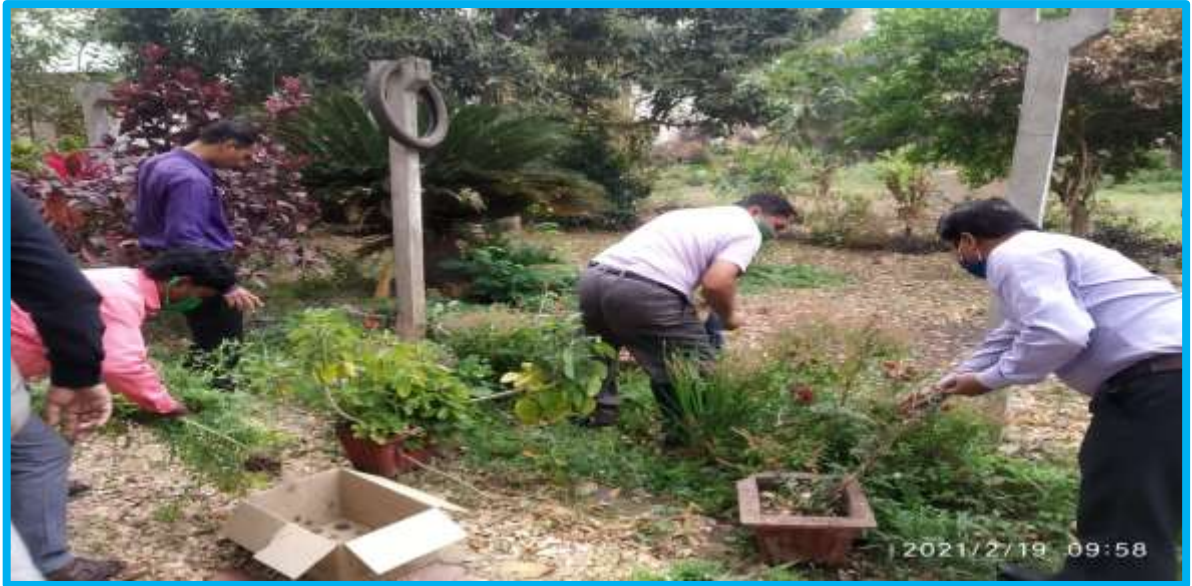
Swachhata Abhiyan on 19/02/2022