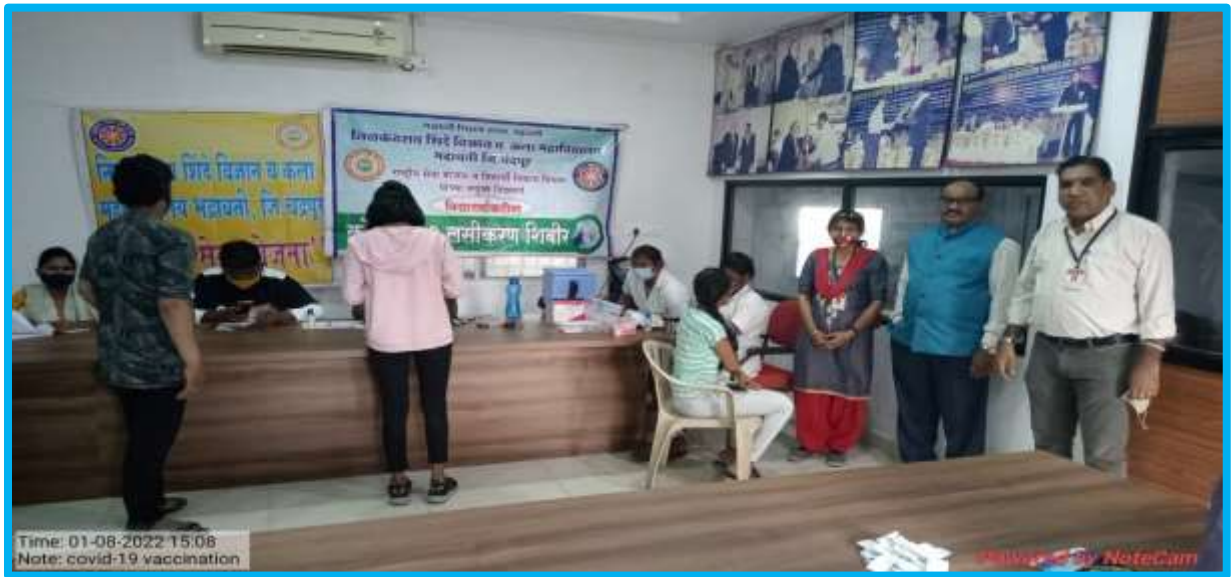
Vaccination 04 th Camp: 08/01/2022 (Total Vaccinated: 300)