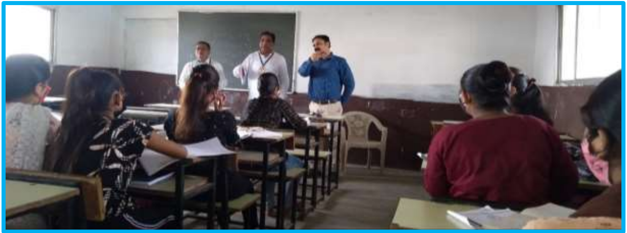
Matdar Nondani Abhiyan 1 to 30 Nov. 2021