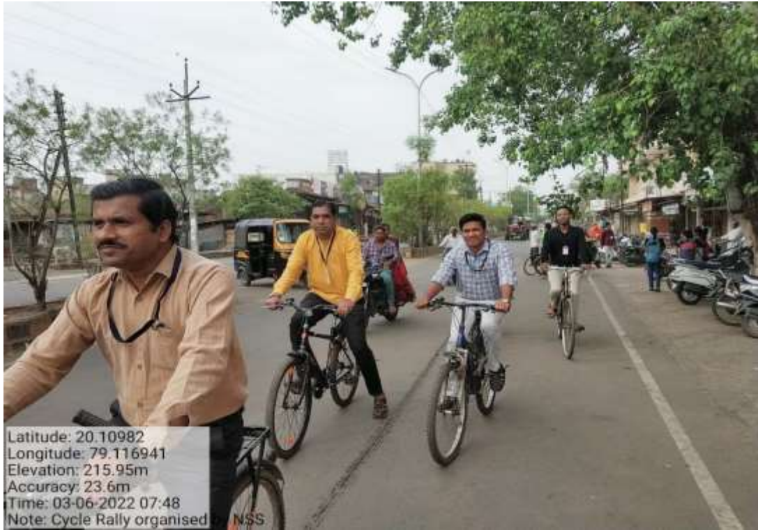
Cycle Rally 03/06/2022