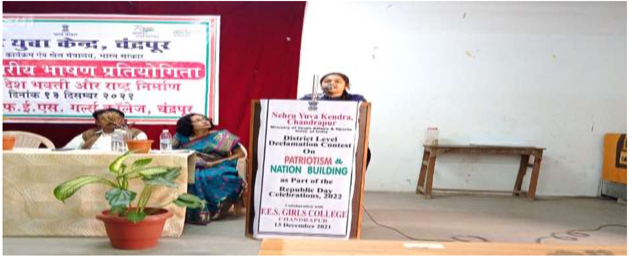
District level Debate Competition - 13/12/2021