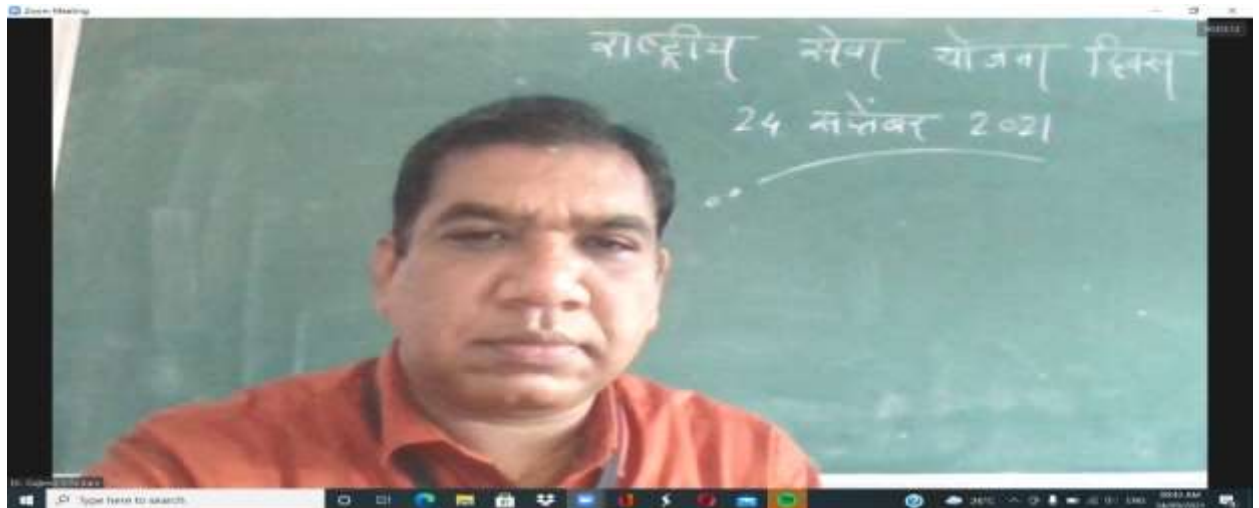
NSS Day 24/09/2021