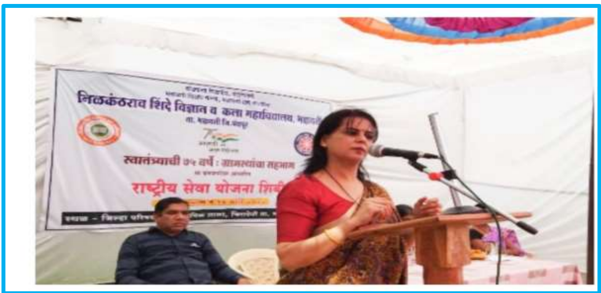
Program on “Women Health” in NSS Camp at Chiradevi 12 th March 2022