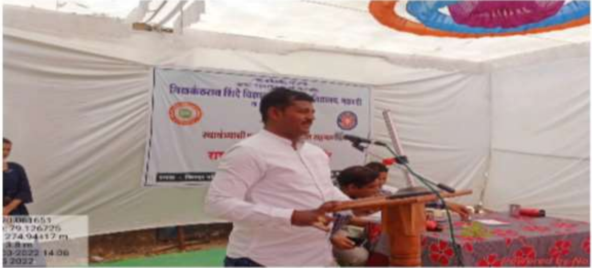
Program on Digital Literacy in NSS Camp at Chiradevi 13 th March 2022