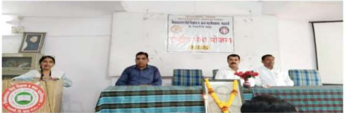
Dr Babasaheb Ambedkar Jayanti 14/04/2022