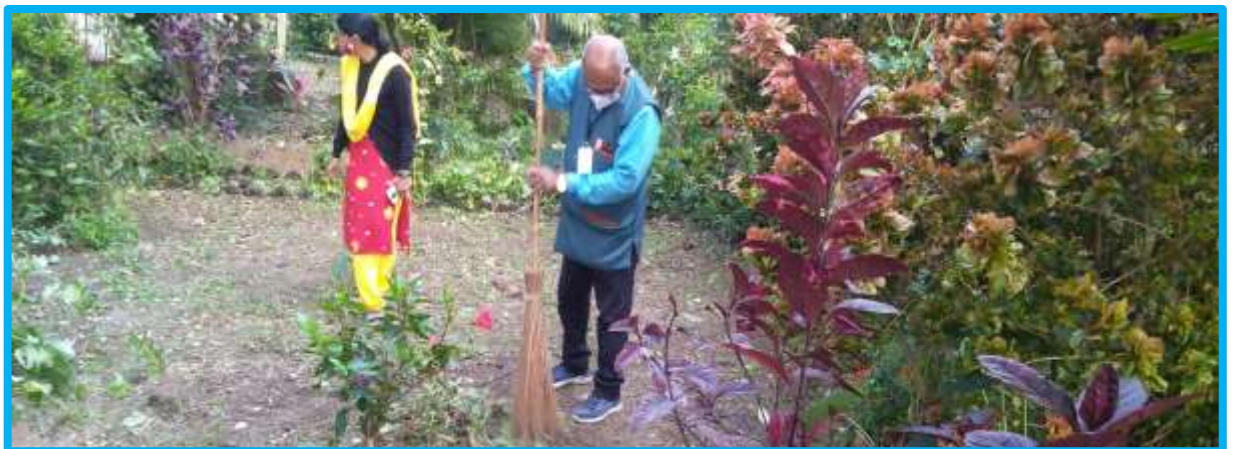
Swachhata Abhiyan on 20/01/2022