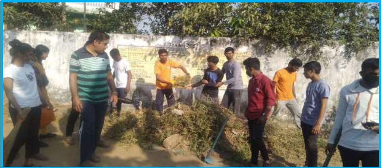
Swachhata Abhiyan in NSS Camp at Chiradevi 10 to 16 th March 2022