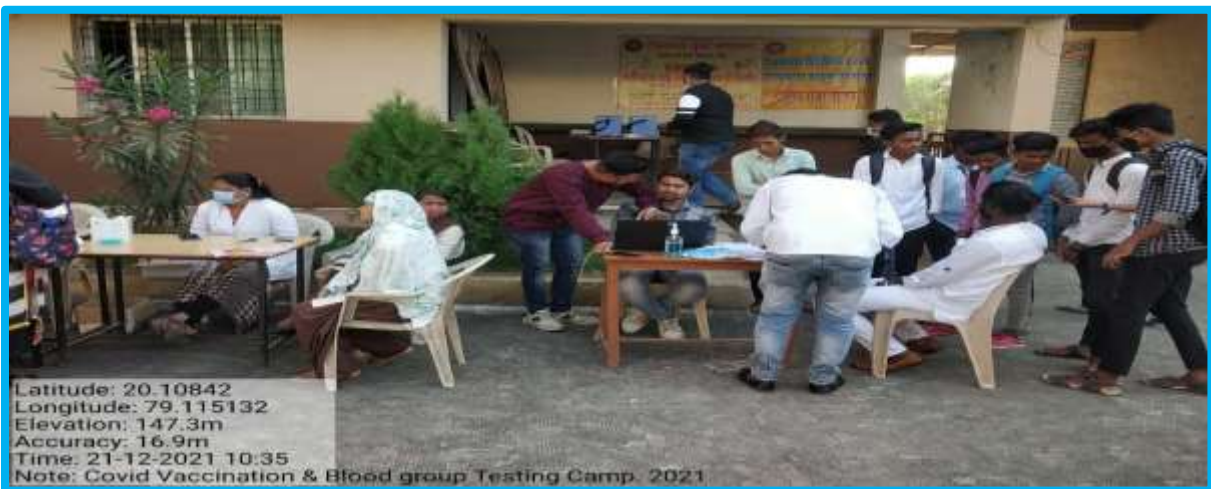
Vaccination Third Camp: 21/12/2021