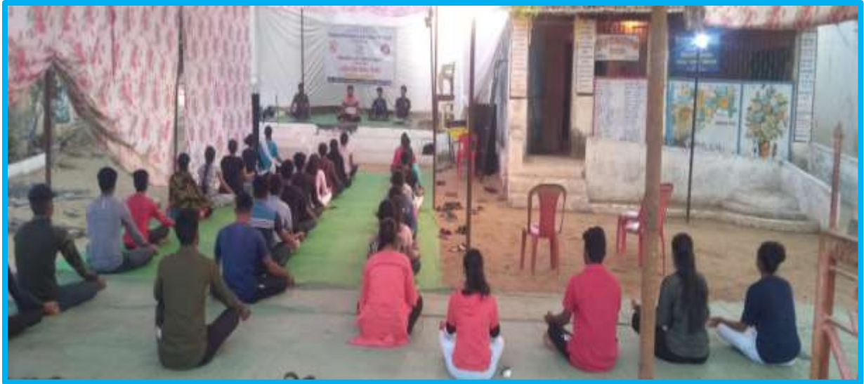
Yoga in NSS Camp at Chiradevi 10 to 16 th March 2022