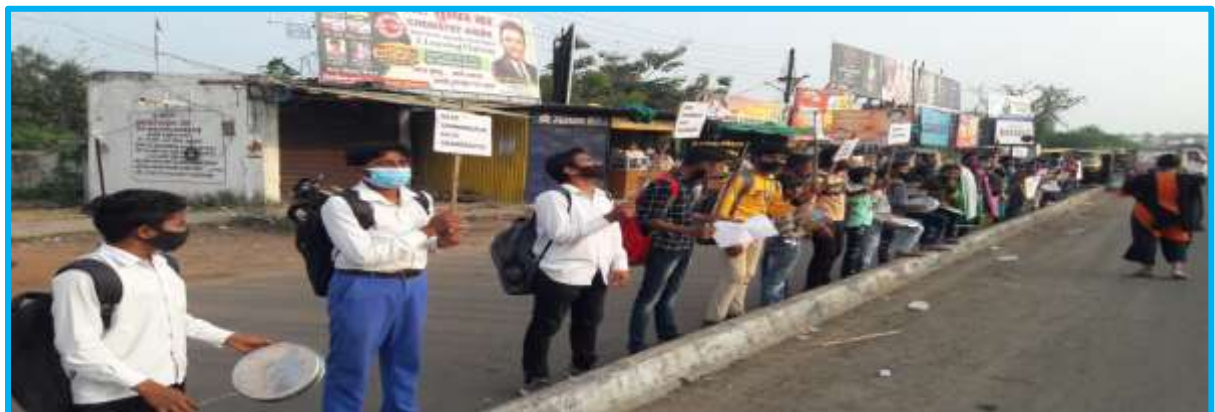
Environment Awareness on Every Third Friday of the month