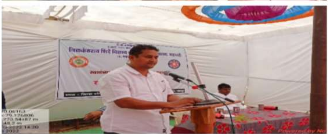
Program on "Importance on Sports" in NSS Camp at Chiradevi 13 th March 2022