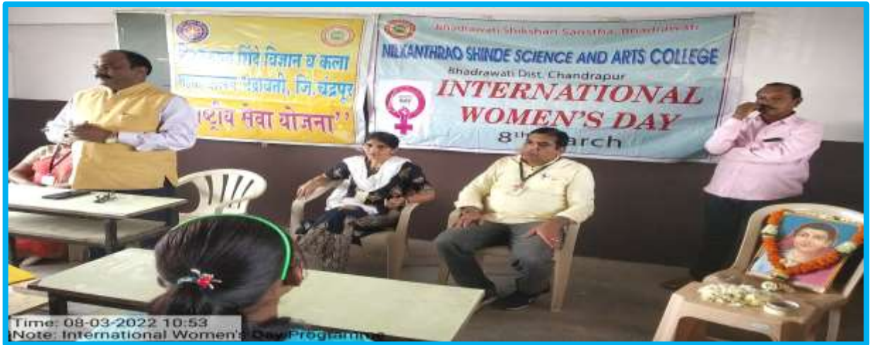
International Women's Day 08/03/2022