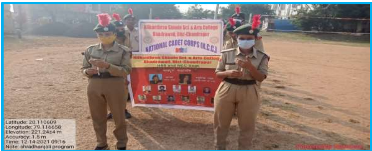
Shahidanna Shradhanjali 14/12/2021