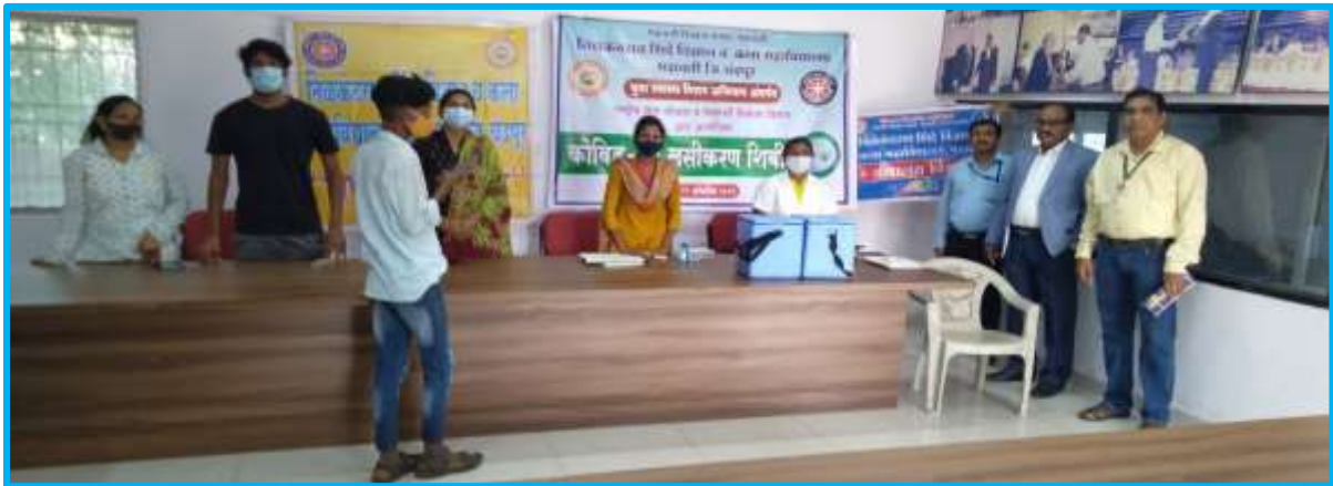
Vaccination Second Camp: 29/10/2021