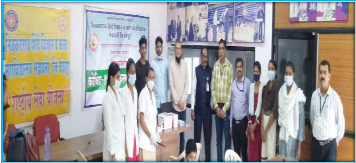
Vaccination First Camp: 23/10/2021