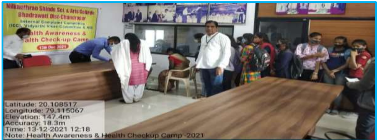
Health Check-up Camp 13/12/2021