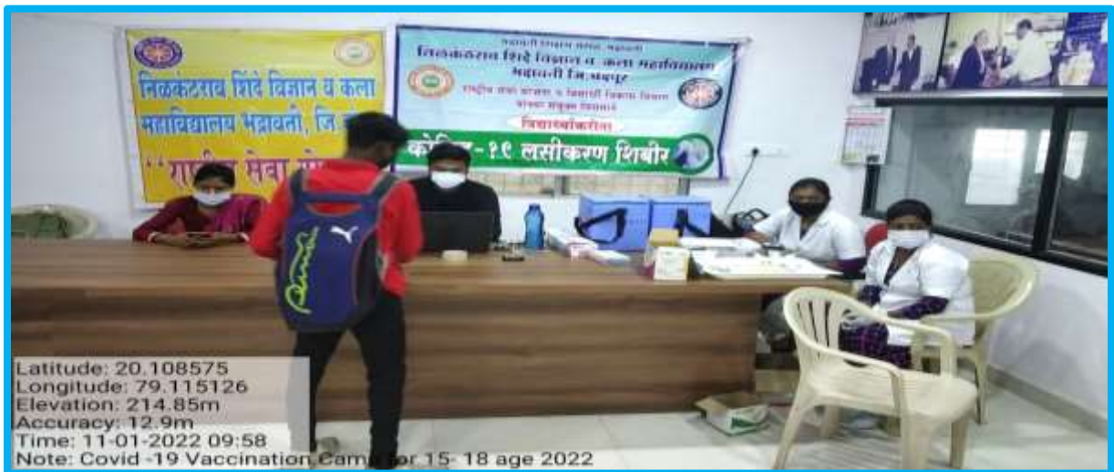
Vaccination 05 th Camp: 11/01/2022 (Total Vaccinated: 300)