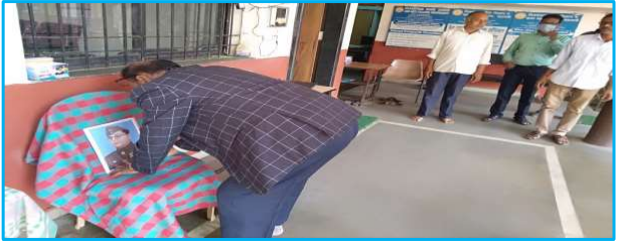
Parakram Din 23/12/2021